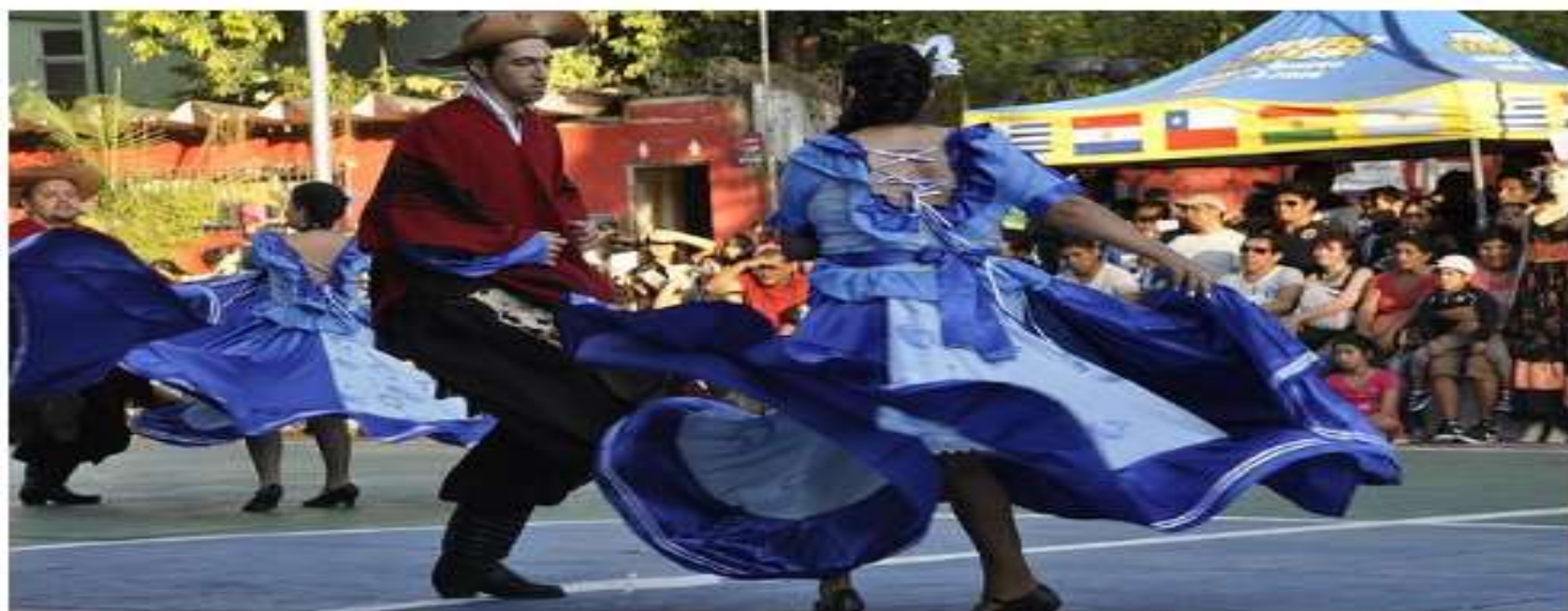
Bolivianos dançam na tradicional festa realizada na Praça Kantuta, na Zona Norte de São Paulo. -comunidade-estrangeira-em-s.htm